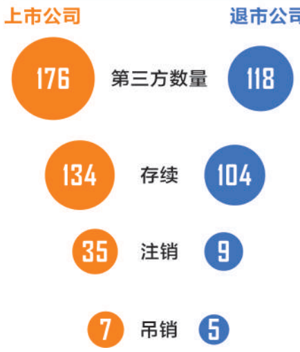
表4：配合造假的第三方现状

虚构销售，49家以供应商身份配合伪造采购，105家兼具双重身份，28家充当资金周转“过桥方”（表2）。在58起造假案中合计超过686家共同构成造假链条。